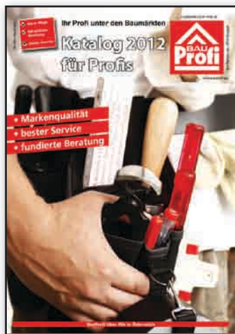
Titelseite des Baumarktkatalogs 2012 (vorläufiges Cover)

Durch die Zusammenarbeit mit unseren Lieferanten und deren Unterstützung können wir Ihnen einen Baumarkt-Katalog zur Verfügung stellen. Der über 120 Seiten starke Katalog bietet ein umfangreiches Sortiment über alle Abteilungen. Diese Artikel dienen als Anregung für Ihre Kunden, dass über das ausgestellte bzw. lagern- de Sortiment hinaus noch vieles weitere kurzfristig besorgt werden kann. Alle Artikel im Katalog sind natürlich mit DFH-Nummer oder EAN-Code versehen und können rasch im DOIS aufgefunden und über das Zentrallager oder beim Lie-