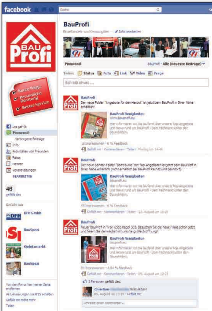
Über einen Link gelangt der User zur BauProfi-Facebook-Seite