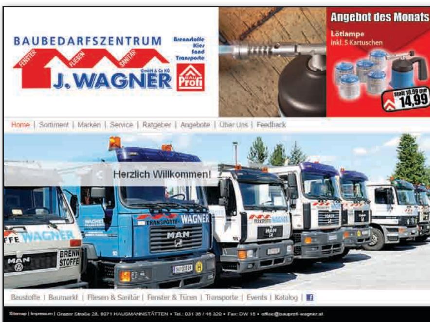
Partnerseite am Beispiel von BauProfi Wagner (bei Druck noch im Entstehen)